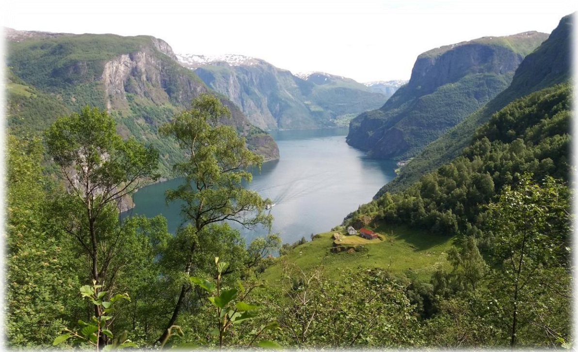
Aurlandsfjorden og Øvste Stegen