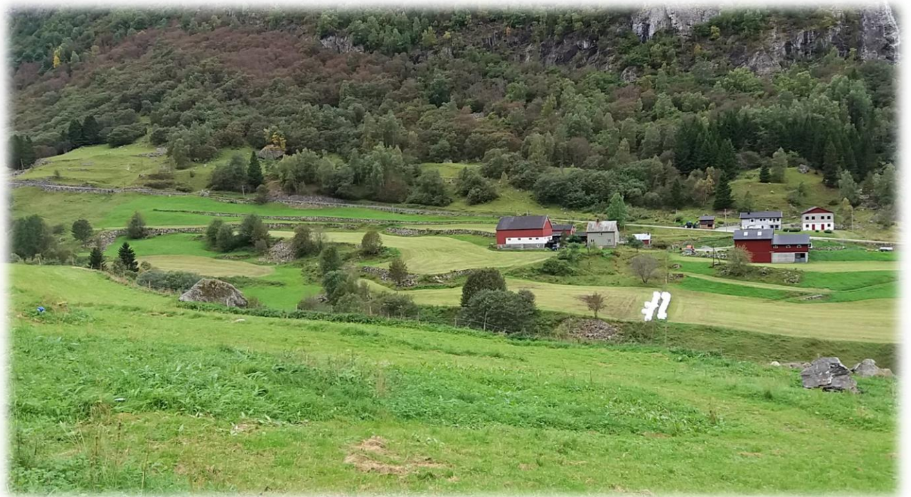
Erdal Foto: Magnhild Aspevik