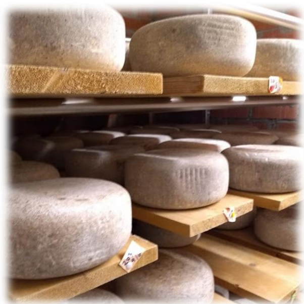
Geitost frå Undredal