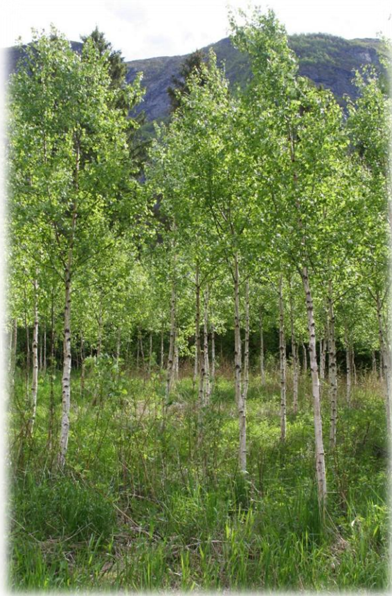
Valbjørkfelt i Seimsdalen

Skogen i dei tre kommunane er ein viktig ressurs som i dag vert lite utnytta. Den mest verdfulle skogen ligg vanskeleg tilgjengeleg i bratt terreng utan vegtilkomst. Statlege og kommunale midlar kan her bidra til bygging av veg, slik at nye skogområde kan gjerast økonomisk drivverdige.