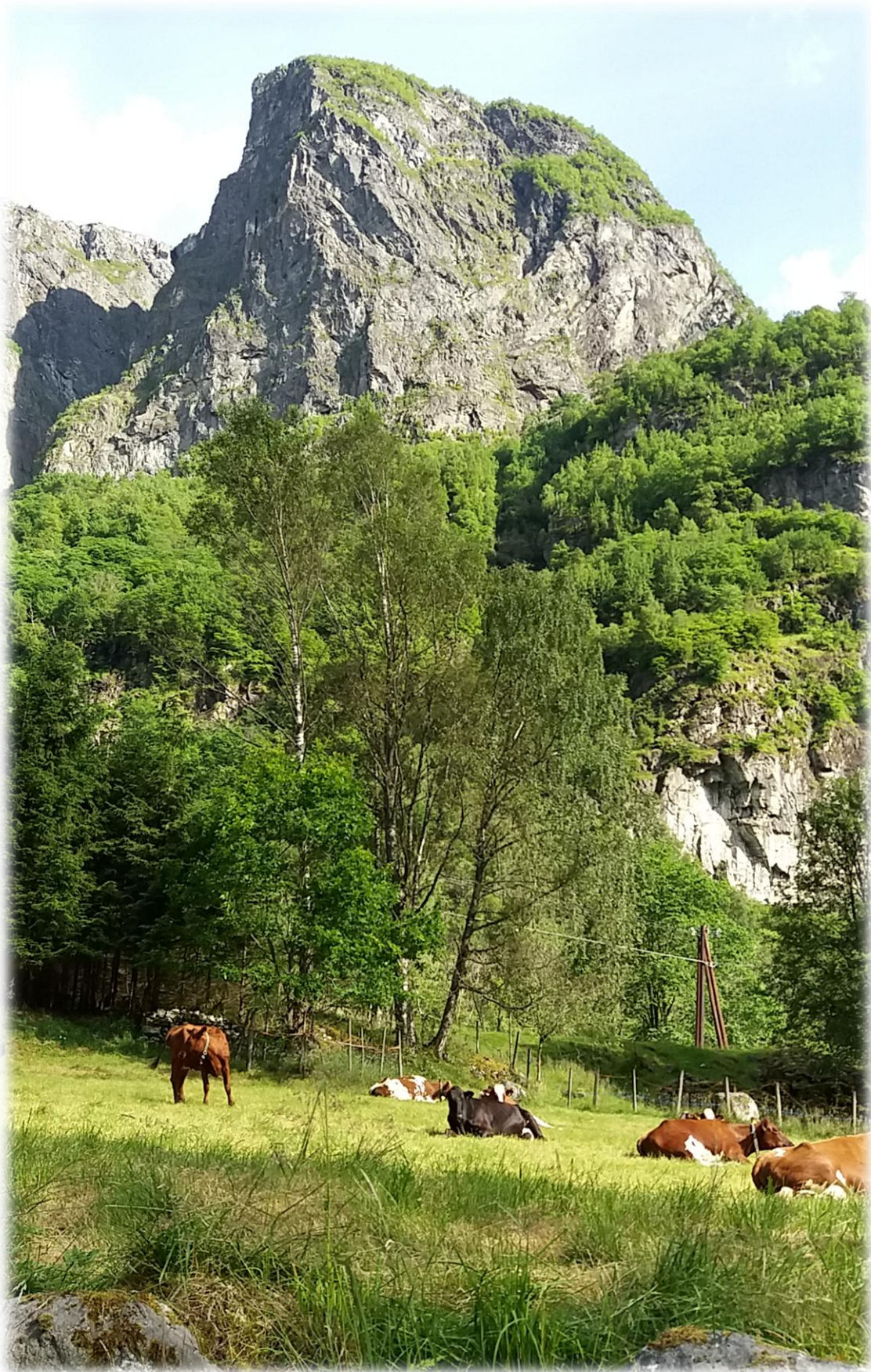
Kyr på beite i Gudvangen