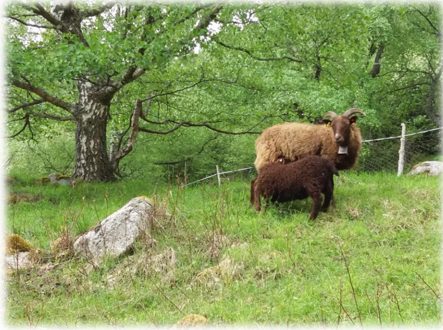
Sau og lam