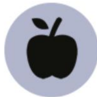
Frukt & bær