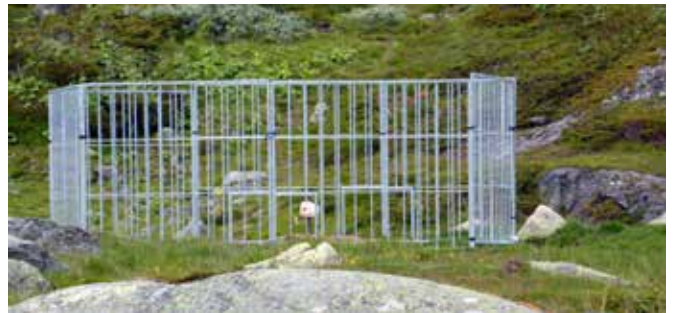
Grindeanlegg for saltstein

Nye reglar for bruk av saltstein var i starten svært krevjande då desse vart endra kvart år. No ser me at