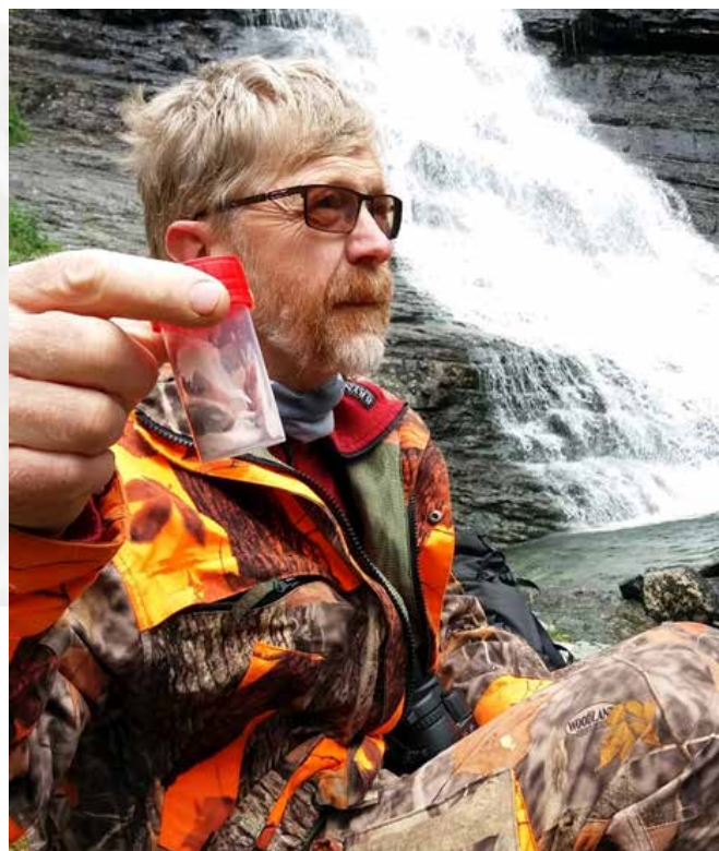
CWD koordinator under prøvetaking av fallvilt.

Lærdal Kommune tok på seg arbeidsgjevar ansvaret og stilte kontor til disposisjon. Det meste av kostnadane med dette arbeidet har kommunen fått dekkja gjennom tenestekjøpsavtale med Miljødirektoratet.