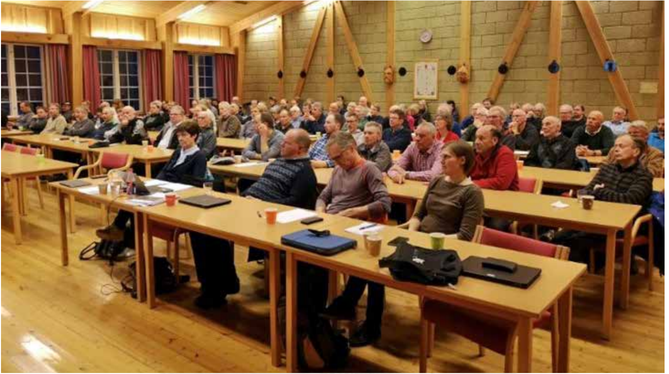
Frå opent informasjonmøte på Torpo

CWD-stoda har fått fylgjer for fleire område mellom anna hjorteviltforvatning. CWD har vorte eit naturleg tema på møter, fagdagar, samlingar og konferansar