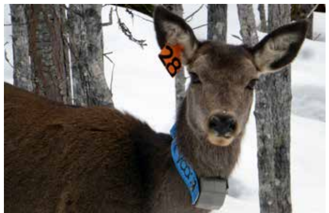
Merka hjortekolle på Frønningen i Lærdal

For å dokumentere områdebruk, spesielt for hjort, vart det i 2017 starta opp eit merkeprosjekt der hjort vart påmontert halsband med GPS sendar. Dette har avdekkat at enkelte dyr vandrar lange avstandar mellom vinter- og sommarbeite, og dei kryssar fleire kommunegrenser. Det er og stor overlapping av beiteområde for hjort og villrein inn mot sone 1, spesielt i Lærdal og Aurland. Etter funn av CWD, er det fram til no merka 50 hjort i område.