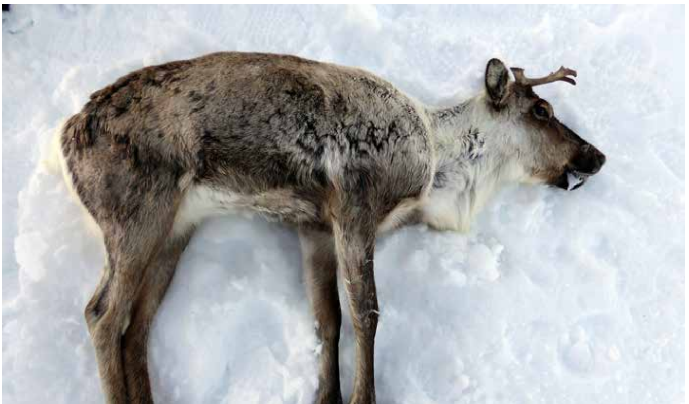
Fyrste villrein som testa positivt på CWD

Resultatet av CWD-testen har seinare vorte ein av premisseleverandørane for hjorteviltforvaltning i Noreg. Det er før og etter 15. mars 2016.